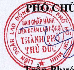
Trần Phước Hùng